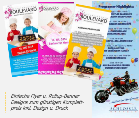
Einfache Flyer u. Rollup-Banner Designs zum günstigen Komplett-preis inkl. Design u. Druck

Farben und Designs an Ihr Center oder an das Event-CI angepasst. Eine runde Sache!