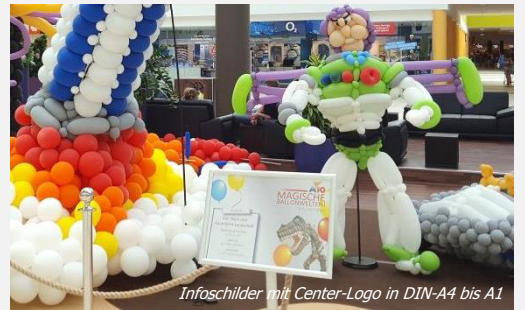
Infoschilder mit Center-Logo in DIN-A4 bis A1